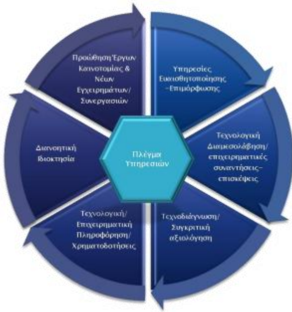
Σχήμα 1: Πλέγμα Υπηρεσιών Μονάδας Καινοτομίας και Συνεργατικών Σχηματισμών ΙΜΕ ΓΣΕΒΕΕ